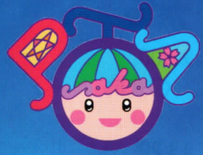
大阪府Pキャラクター「ビタマル」